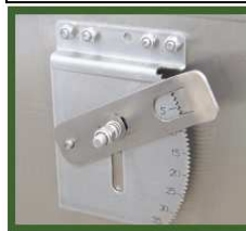
204 Stainless Food Trough